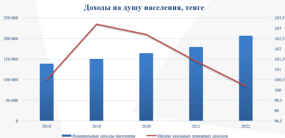
График 3. Номинальные и реальные доходы населения 2018-2022 гг.

Среднедушевые номинальные доходы населения в г. Алматы в 2022 году составили 206,6 тыс. тенге, что почти на 26% превышает средний показатель по Казахстану. Несмотря на рост номинальных доходов населения Алматы, реальные доходы населения выросли всего на 0,2%. При этом, доля затрат на продовольственные товары в структуре расходов населения увеличивается и составляет в среднем 51% от общих затрат.