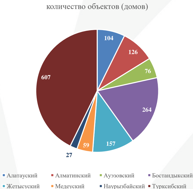
График 6. Количество жилых объектов по районам города Алматы.

Более 500 домов находятся на красных линиях, в санитарных и водоохраных зонах.