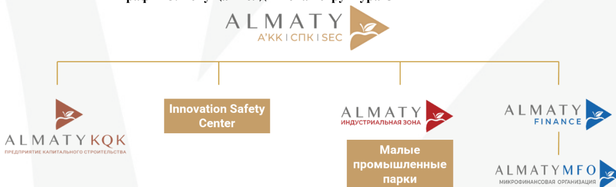
График 5. Текущая холдинговая структура СПК

Текущая структура представляет механизм взаимодействия с ДЗО, где основой управления являются функциональные подразделения Общества. В перспективе развития по 2025 года Общество стремится к совершенствованию холдинговой структуры. Общество оставит за собой функционал портфельного управления дочерними, зависимыми организациями, определяя стратегическое направление деятельности, приоритеты и целевые КПД.